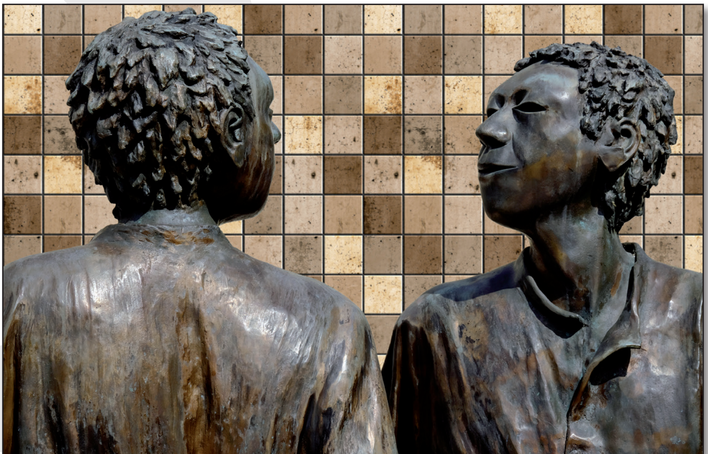
Juan Larbán: Está comprobado que el niño autista carece de esa percepción de interioridad, de mundo interno, de subjetividad y, por lo tanto, hay imposibilidad de comunicación intersubjetiva, que es el poder comprender al otro como si estuviese en su lugar, sin confundirse con él.