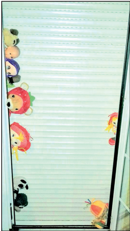
Es de noche, ya no es hora de estar en el jardín.

Estoy especialmente alerta a la angustia que manifiestan mis pacientes; creo que ello es mi responsabilidad en el tipo de consultas de seguimiento psiquiátrico que les ofrezco. Mis pacientes me han mostrado que con frecuencia conseguimos dotar con los tratamientos las primeras herramientas para que puedan comunicarse con el mundo que les rodea y observarlo. A través de la contención de sus figuras de apego y por el encuentro con sus ojos (a los que ya miran), viven el reclamo de abandonar su aislamiento. Lo que les ofrecemos parece hacerse más atractivo (los niños en el parque ya no les disturban y les gusta ver lo que hacen; imitan...) y empiezan a dar los primeros pasos hacia nuestro mundo. Con frecuencia, parecieran vivir un abismo entre ambos mundos descubriendo una inseguridad que tiende a hacerles retroceder en ese mundo interior que lleva el ritmo que ellos determinan. Pero ven que sus padres y personas importantes con las que quieren estar les llaman desde el otro lado. No ven el puente y los “zapatos lingüísticos” que han empe-