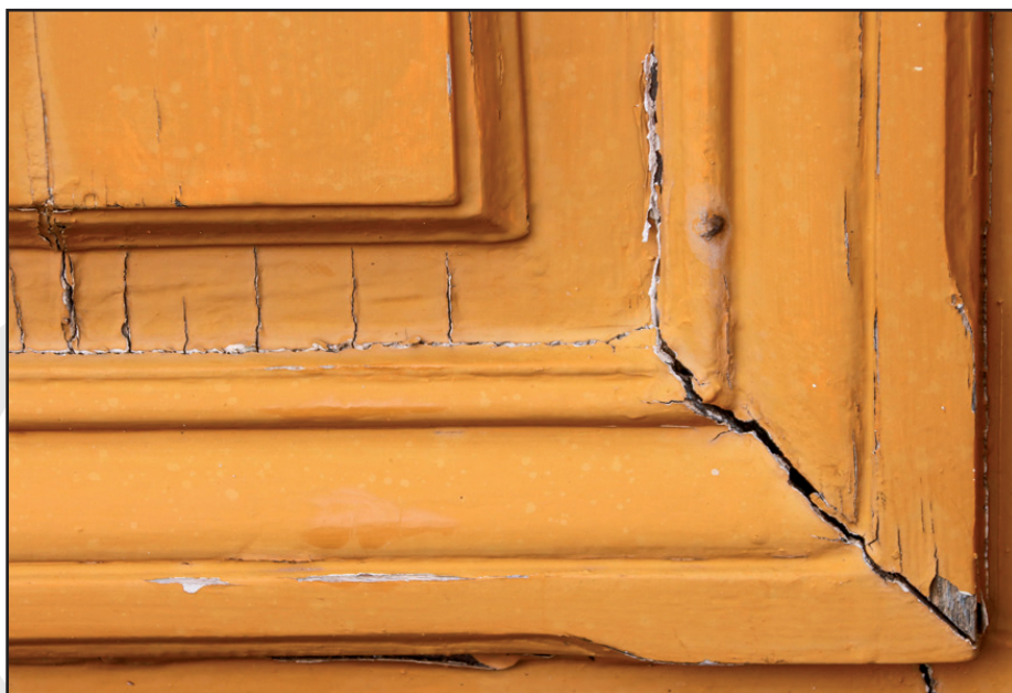
Es la construcción gradual de un buen objeto interno, mediante el uso de la presencia total cuerpo-mente del analista, lo que en última instancia promueve la representación y la consolidación interna del objeto bueno.