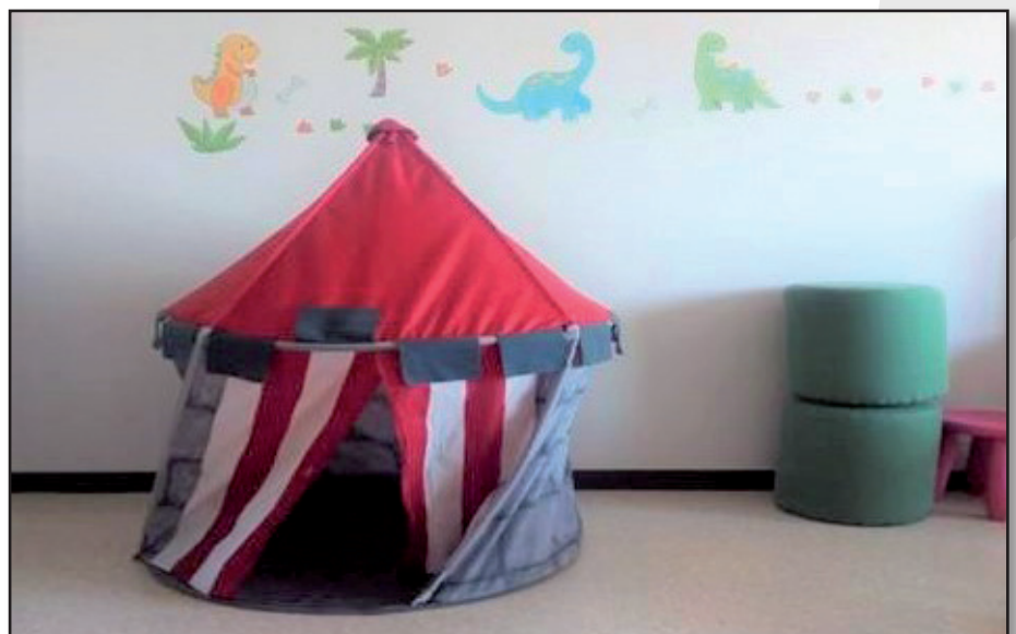
En este proceso dinámico, el lugar del terapeuta como observador participante es el modo de estar más respetuoso con los padres ayudando a pensar y validando siempre su hacer y saber parental.

Las devoluciones se reflexionan, preparan y se llevan a cabo de manera individualizada y en formato individual con cada una de las familias, en entrevistas concertadas con ellas con este objetivo. Es decir, que el cierre grupal no conlleva una devolución diagnóstica en sí misma, aunque sí favorecemos que se pueda