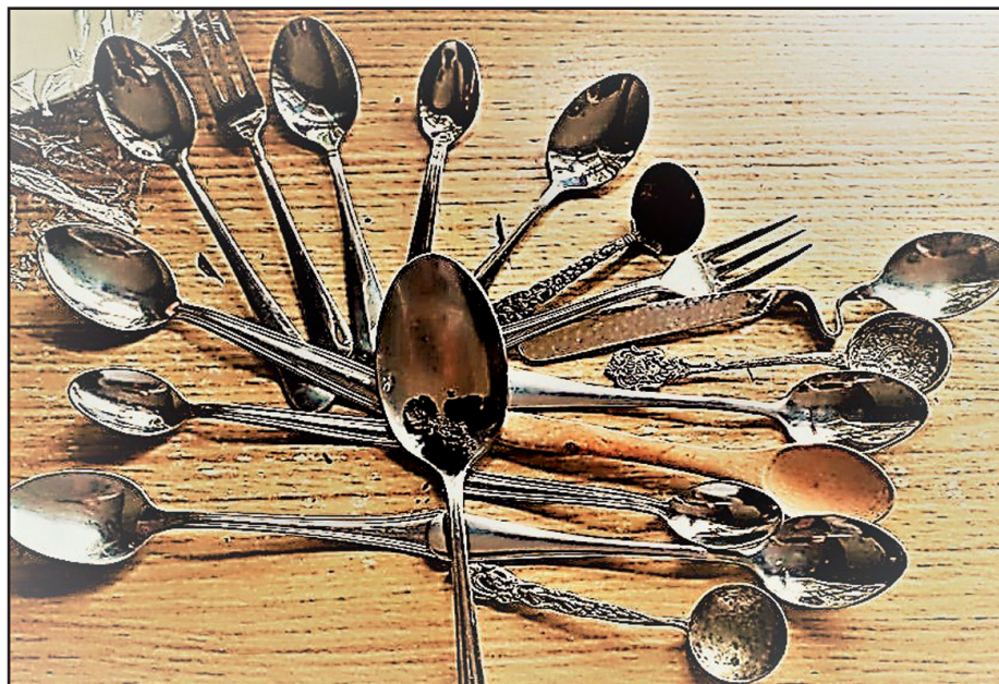
Árbol de la vida, tras dos meses de confinamiento.

“En lo que sigue, describiré un tipo de niño particularmente interesante y fácilmente reconocible. Los niños que presentaré tienen todos en común un trastorno fundamental que se manifiesta en su apariencia física, en las funciones expresivas y en la totalidad de su conducta. Este trastorno conlleva unas severas y características dificultades en la inte-