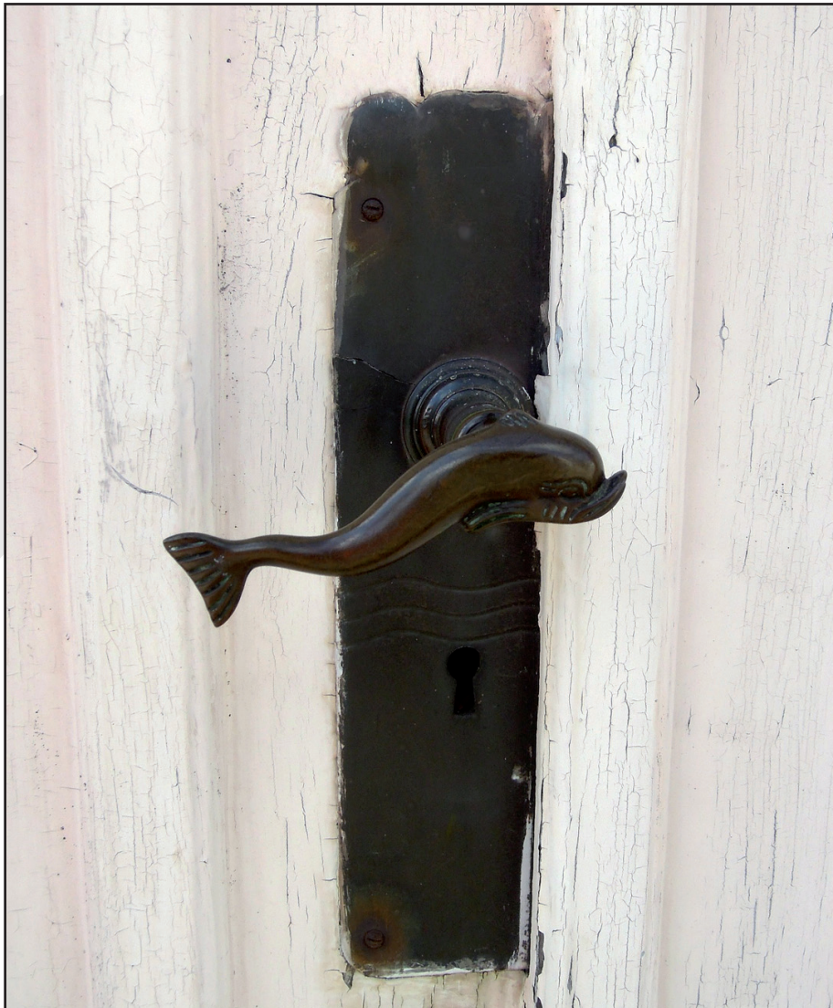
Ni las obsesiones ni su interés único por los cetáceos fueron un impedimento para que construyera su mundo, lo organizara y transformara su tema de interés en un modo de relacionarse con los otros, logrando una adaptación social satisfactoria.

Durante su paso por el bachillerato, sus libretas de arte ocupaban un interés conjunto en cada sesión. A través de sus creaciones, se abrió la posibilidad de intercambiar momentos de angustia desbordante que la adolescencia le generaba, instantes en los que su estructura inerte tambaleaba y amenazaba con caerse.