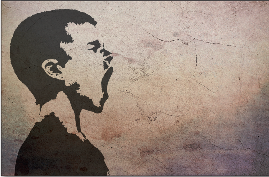
Creo que hay, de hecho, dos espectros: uno es puramente autista y el otro es autístico-psicótico. La principal diferencia entre estos dos espectros radica en la naturaleza de las ansiedades y defensas involucradas.

dos sus padres; falta de coordinación e integración corporal; alternancia entre estados de laxitud y rigidez; agitación psicomotriz; autoestimulación mediante el uso de objetos autistas, formas sensoriales autistas y masturbación; rigidez y conductas repetitivas obsesivo-compulsivas; falta de juego; falta de empatía y de imaginación.