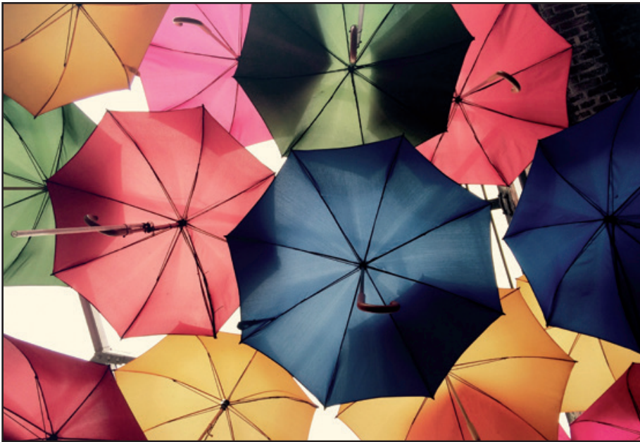
El paciente puede recurrir a diversas organizaciones defensivas o “mantos” concretos cuya función principal es aliviar estas ansiedades creando “envolturas” fisiometales.

el analista. Un elemento básico de la técnica kleiniana clásica, que sigo considerando verdadero y pertinente, es tratar y detectar la ansiedad más profunda y primitiva en cada momento de la sesión e interpretarla en su propio lenguaje, en su punto de máxima urgencia. Sin embargo, debido a la naturaleza desconcertante, concreta y a menudo presimbólica de estas ansiedades tempranas y al rápido movimiento entre varios niveles de ansiedad que caracterizan a los pacientes autistas o con núcleos de autismo, la tarea del analista se vuelve realmente difícil.